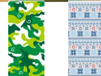
※上記写真はイメージです。